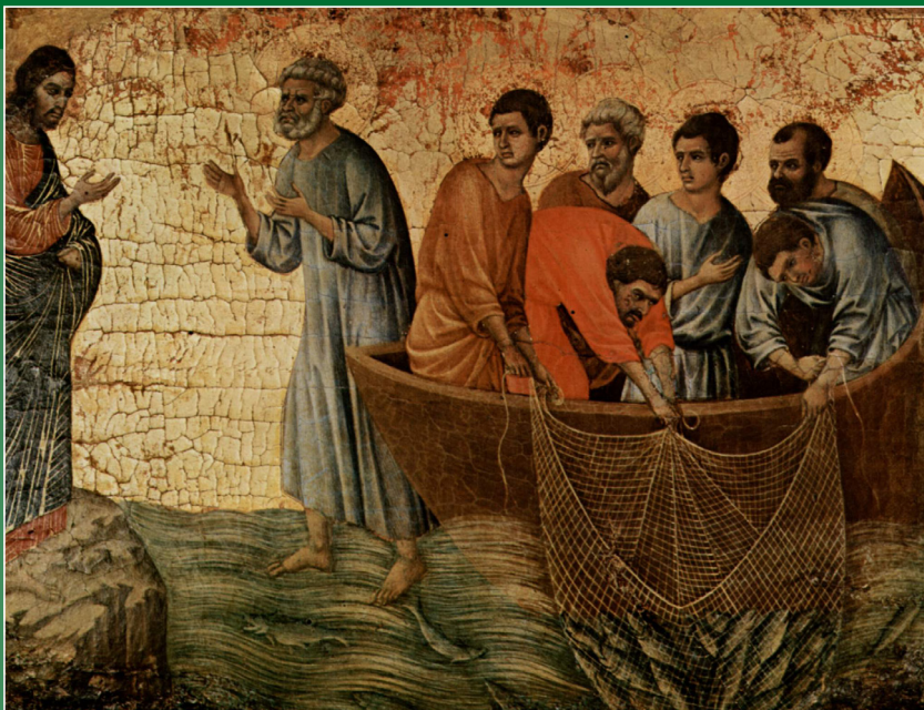
Duccio di Buoninsegna, Jeesuksen ilmestymisen opetuslapsille Tiberiaanjärvellä (1308–1311)